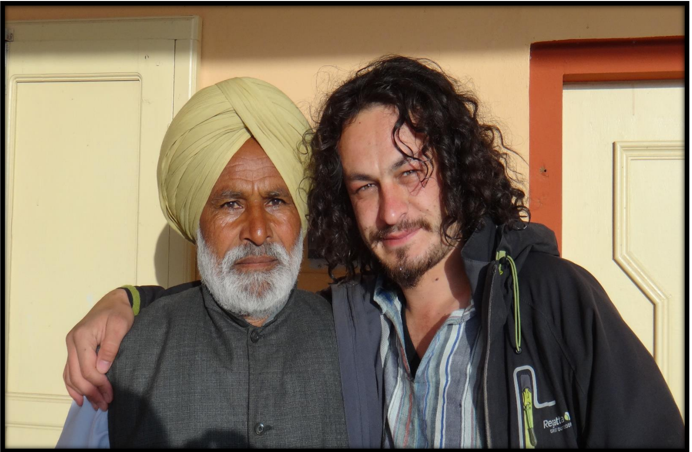
Chez l' habitant, INDIA-Rajasthan

,media,écoles, universités, vous pouvez transmettre ce mail à vos connaissances.