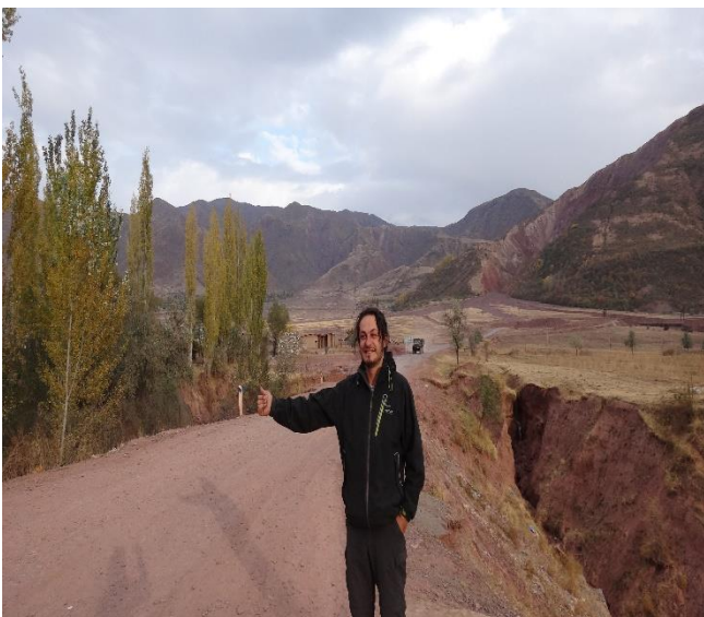
(stop au tadjikistan)

Il y a 5 ans, (27/04/12) , j'ai décidé d'accomplir mon rêve d'enfant et d'explorer le monde en stop par les terres et mer, savourer toute la beauté de la nature.. et de me sentir utile à travers des volontariats dans les écoles (partage du voyage), et autres.. Je suis parti, en laissant tout derrière, par une décision radicale. (ex cadre).