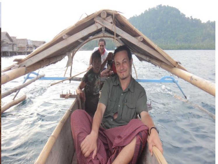
(bateau stop en indonesie)